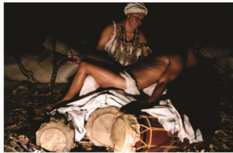
Peça conta a história da lenda das Yabás passando ainda por outros Orixás como Yemanjá, Exu, Xangô, Ogun, Omolu e Oxalá

'Lenda das Yabás' traz à tona a história da ancestralidade da cultura afro-brasileira, bebendo da sua fonte mais pura ao se utilizar das lendas de quatro Yabás (orixás femininas): Yansã, Obá, Eiwá, Nanã e Oxum. O texto tem o objetivo de estimular o público a conhecer uma história intensa, oferecendo diálogos diretos criados com o intuito de humanizar as personagens centrais.