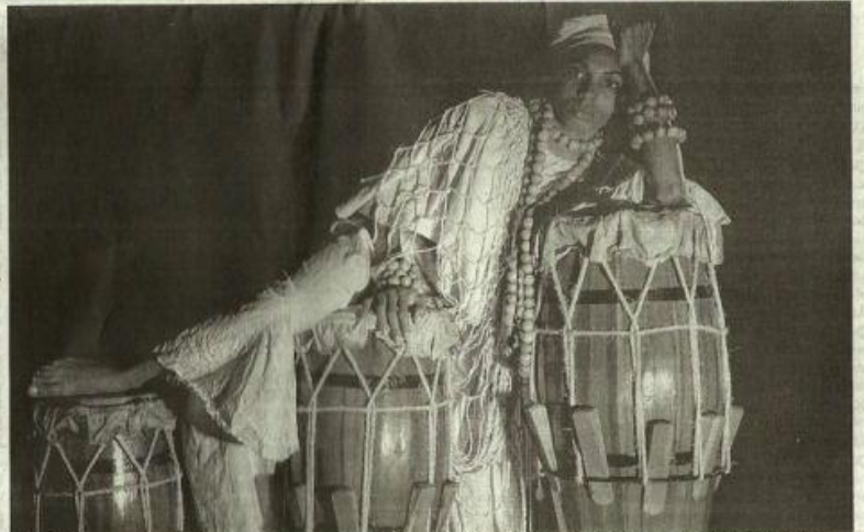
Os atabaques são tocados pelos atores durante o espetáculo, em interação com a história contada

Olorum, revoltado com a destruição e discórdia que os homens causaram na Terra, resolve fertilizar todas as mulheres (as Yabás) para extinguir a raça humana e prender a chuva para secar a Terra. A partir daí a trama se desenrola, com a participação das Yabás, representadas cada uma com um perfil femi-