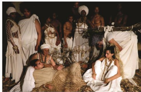
Espectáculo 'Lendas das Yabás' será apresentado entre os dias 12 e 30 de janeiro

O espetáculo 'Lenda das Yabás' será apresentado no Centro Cultural Ensaio, Garcia, entre os dias 12 e 30 de Janeiro, aos sábados e domingos, às 20h. O texto conta a história da lenda das Yabás passando ainda por outros Orixás como Yemanjá, Exu, Xangô, Ogun, Omolu e Oxalá. Os ingressos custam R$20 (inteira) e R$10 (meia).